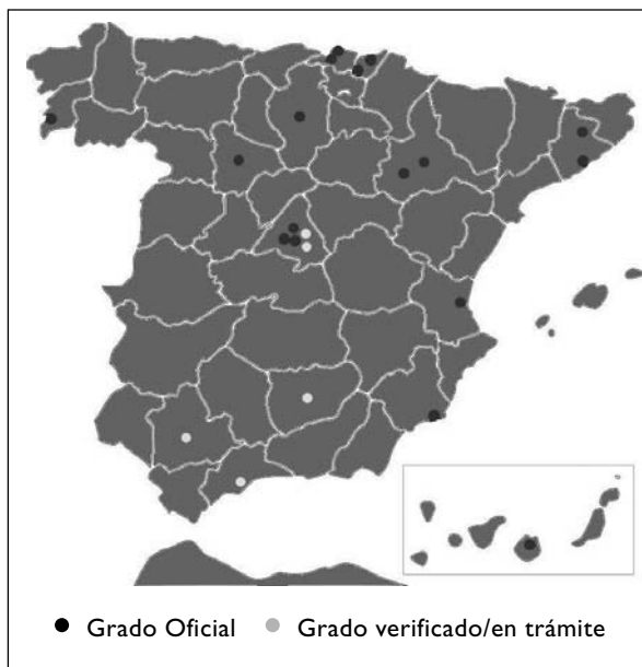
Figura 1 Mapa de la presencia del GIOI en España

La oferta de plazas se aprueba anualmente en el Consejo de Universidades y se publica en el Boletín Oficial del Estado. La Tabla 4 muestra la oferta de plazas, según datos del MED en los centros universitarios españoles donde se imparte la titulación de GIOI. El total de las plazas ofertadas en esta titulación ha sido de 1130 plazas en el curso 2010/2011 y de 1283 en el curso 2011/2012. Los centros con mayor oferta de plazas son el Centro Universitario de la Defensa de Zaragoza adscrito a la Universidad de Zaragoza y la Escuela Técnica Superior de Ingenieros Industriales de la Universitat Politècnica de València.